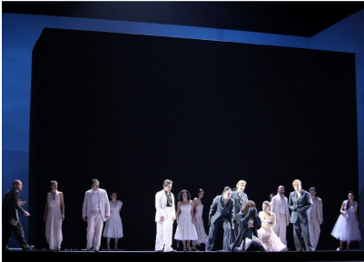
Scenă din actul I