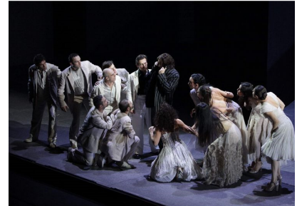
Scenă din actul II