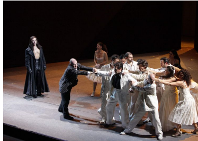
Scenă tot din actul I