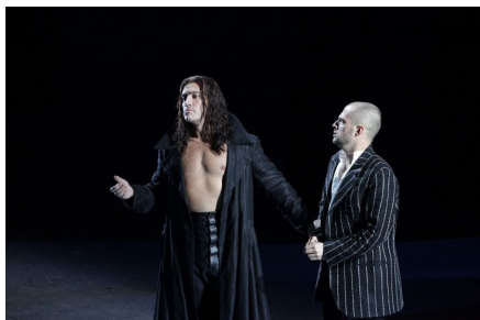
Erwin Schrott și Alex Esposito

Ei, da, un macho ca-n filme! Așa arată Erwin Schrott, noul Don Giovanni scaliger. Nici nu se putea rol mai potrivit pentru bas-baritonul uruguayan! Un tip înalt, athletic (e clar că face body building), cu plete și mai tot timpul cu bustul gol, acoperit doar de o mantie fluturândă la care, bineînțeles, renunță spre finalul operii. Nu pentru mult timp. Doar cât să palpate și mai intens inimile, să se înflăcăreze imaginația suflării feminine din sală. La repetiția generală, la galerie, o domnișoară sexy înarmată cu binoclu marinăresc (!) s-a ridicat în picioare și mi-a luat complet vizibilitatea, și așa nu prea grozavă. Cât a așteptat momentul! Cât o invidiază, sunt sigur, pe frumoasa și reputata soprană Anna Netrebko... mama băiețelului lui Erwin Schrott! Cu amorul nu-i de glumit!